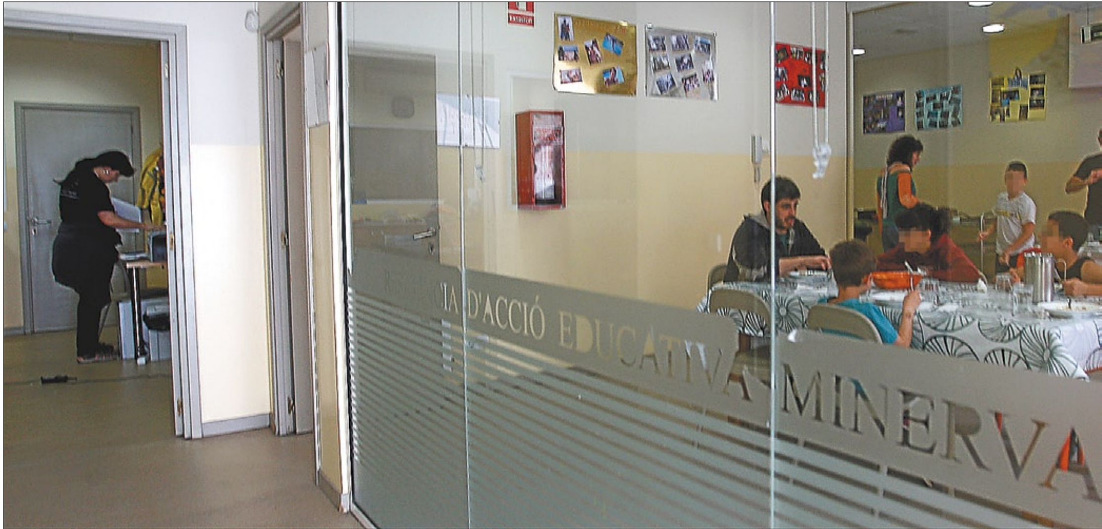
►► El menjador d'un centre de menors de Barcelona, la setmana passada.

Polèmiques com la dels conflictes d'adolescents a Mataró no s'han desencadenat en un CRAE, sinó en un centre de primera acollida.